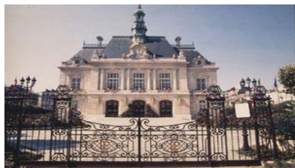
Mairie de Levallois Perret