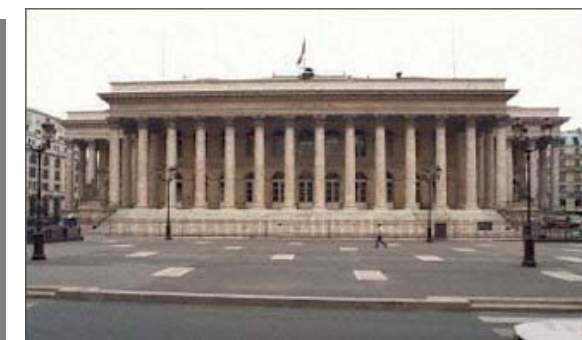
Palais Brognard La Bourse

vous Accompagner pour Contribuer à Gérer en toute Sérénité