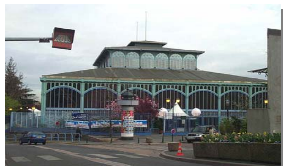
Pavillon Baltard Nogent sur Marne

vous Accompagner pour Contribuer à Gérer en toute Sérénité