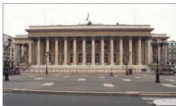
Palais Brognard La Bourse

vous Accompagner pour Contribuer à Gérer en toute Sérénité